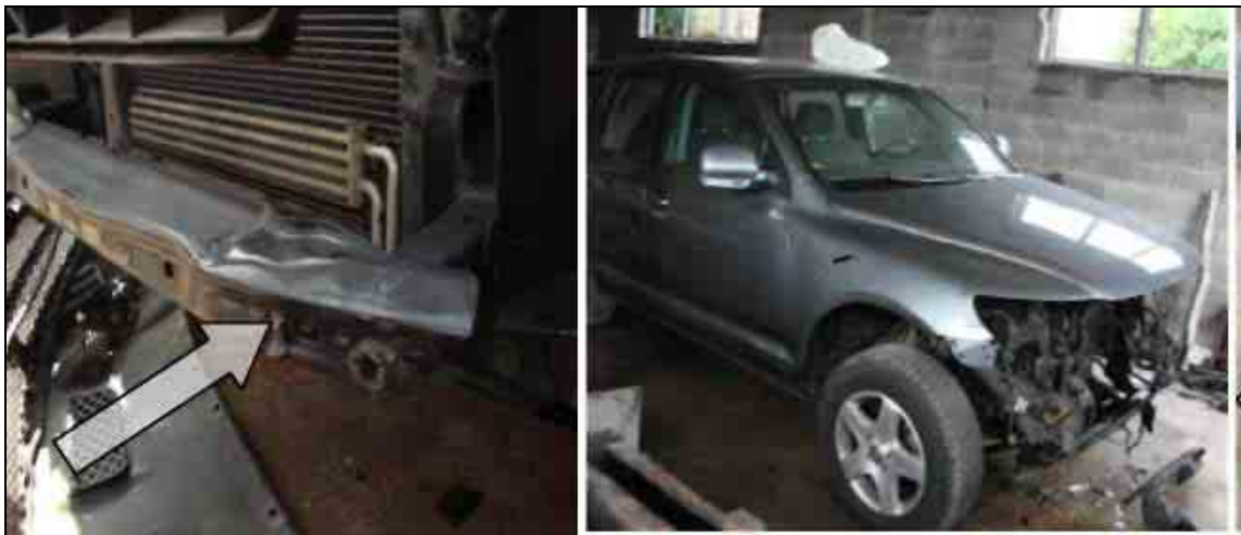
Слика бр. 5

Упоредивањем фотографија утврђено је да шина заиста не припада наведеном возилу. На слици 5 је шина са истог возила за које је раније наплаћена штета, а на слици 6 је шина из пријављене саобраћајне незгоде која очигледно не припада Touaregu.