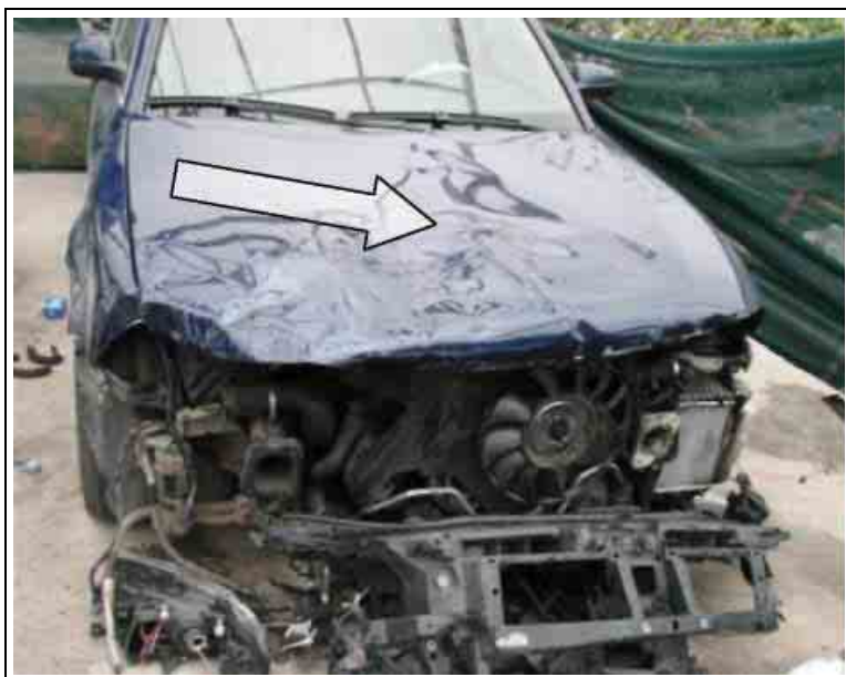
Слика бр. 1

Обе штете пријављене су осигуравајућем друштву, VW Passat по основу АК, VW Touareg по основу АО. Стручна лица xxxxx xxxxxxxxxxxx осигурања су након пријављених незгода изашли на терен како би сачинили записник оштећења. Обе процене су независно рађене у два различита дана и радила су их два независна проценитеља. На првом спроведеном увиђају обојица су запазила да су оштећени делови (њихов већи део) били прислоњени поред аута, а на возилима су запазили и већи број нелогично насталих оштећења на возилима, као што су: