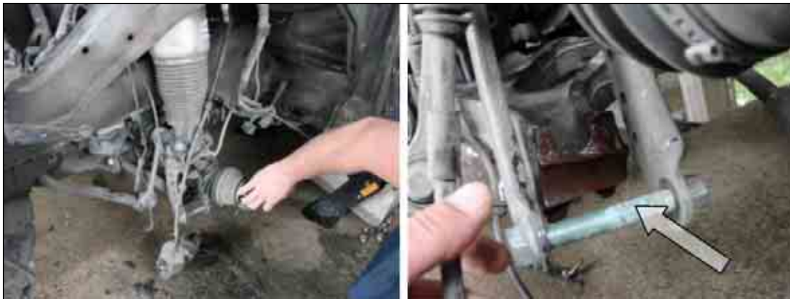
Слика бр. 7