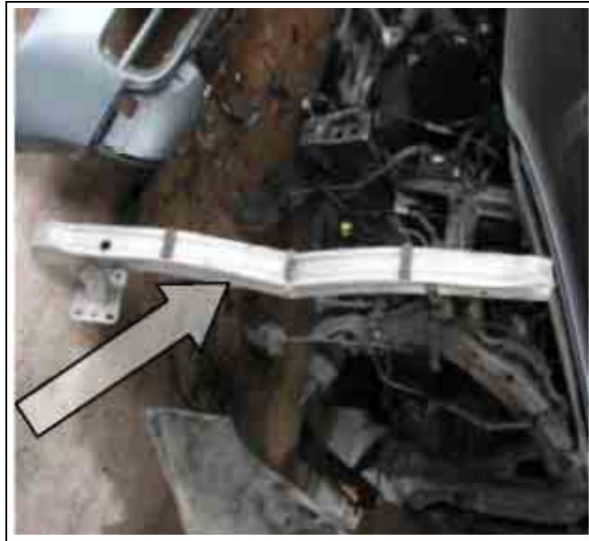
Слика бр. 6