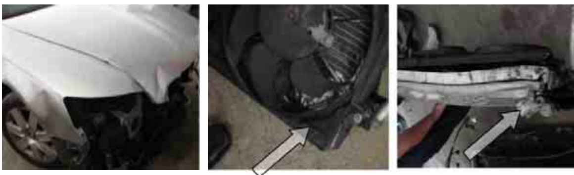
Слика бр. 8

Оштећења хладњака и предњег везног лима на возилу VW Passat били су познати проценитељима из неког ранијег предмета, јер је увиђај и попис оштећених делова извршен у истом окружењу и на исти начин. Након јављања сумње отворени су предмети по пријави штете из АО на возилу Audi из другог штетног догађаја и уочена су идентична оште-