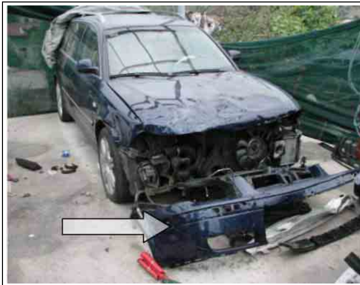
Слика бр. 2

Поред тога на возилу ни оштећења на хладњацима ни на предњем везном лиму нису одговарала описаном начину судара (слике 3 и 4), а што адекватно школовани и обучени вештаци лако могу утврдити и открити у оваквим и сличним случајевима.