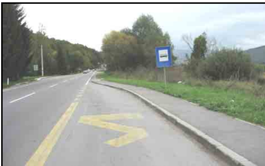
Слика бр. 1

Након детаљне анализе ограничења брзине утврђено је да се место незгоде налази у насељеном месту, али не пролази кроз насеље. Како брзина на овом делу пута није ограничена саобраћајним знаком и како се пут не налази у насељу, то је на месту незгоде брзина ограничена општим ограничењем до 80 km/h (види Сliku бр. 1).