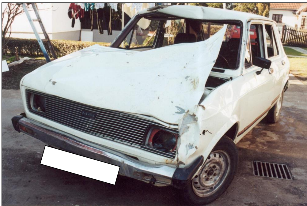
Slika 3. Oštećenja Z-101 pri sudaru sa kravom.

Ukoliko bi brzina krave bila 5,5 km/h, tada bi vozač Z-101 imao mogućnost da blagovremeno preduzetim kočenjem zaustavi Z-101 ukoliko bi Z-101 bila vožena brzinom do 71 km/h, pa bi u ovakvoj situaciji i na strani vozača Z-101 takođe stajao propust uzročno vezan za nastanak ove nezgode, po našem mišljenju.